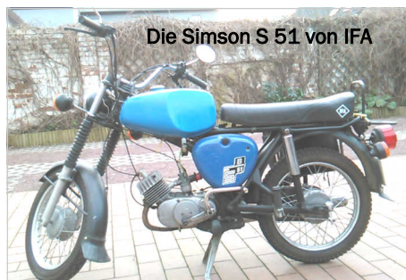
Die Simson S 51 von IFA