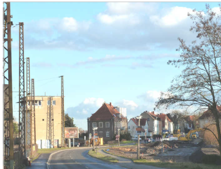
Blick zum Stellwerk Bauarbeiten am Nietlebener Bahnhof