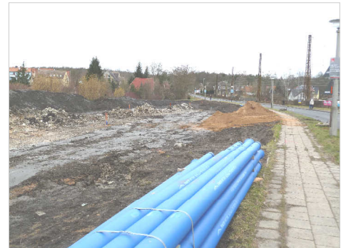
Blick in Richtung Heide Fotos: Ende Februar 2016