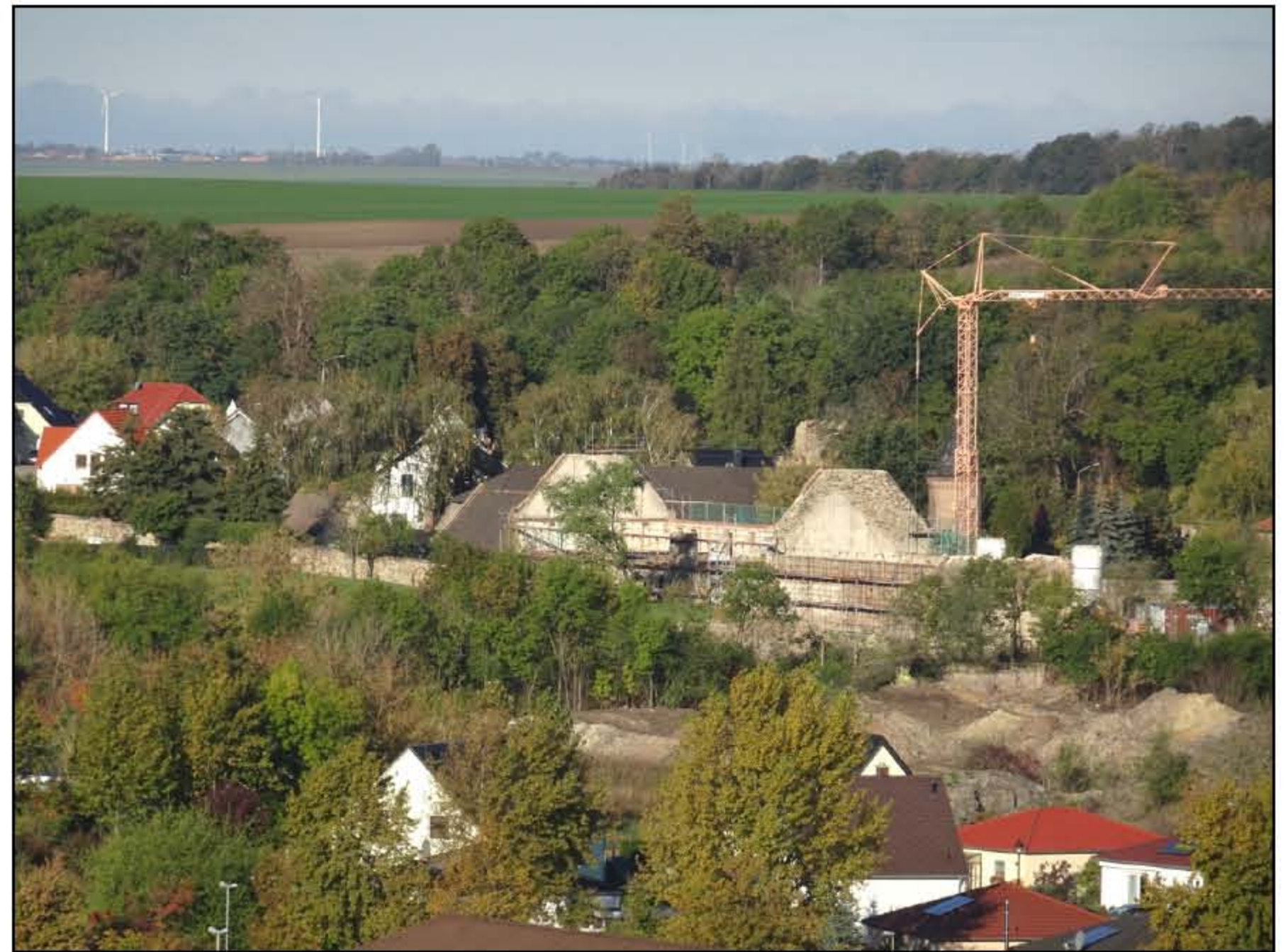
Die Baustelle Gut Granau im November 2020