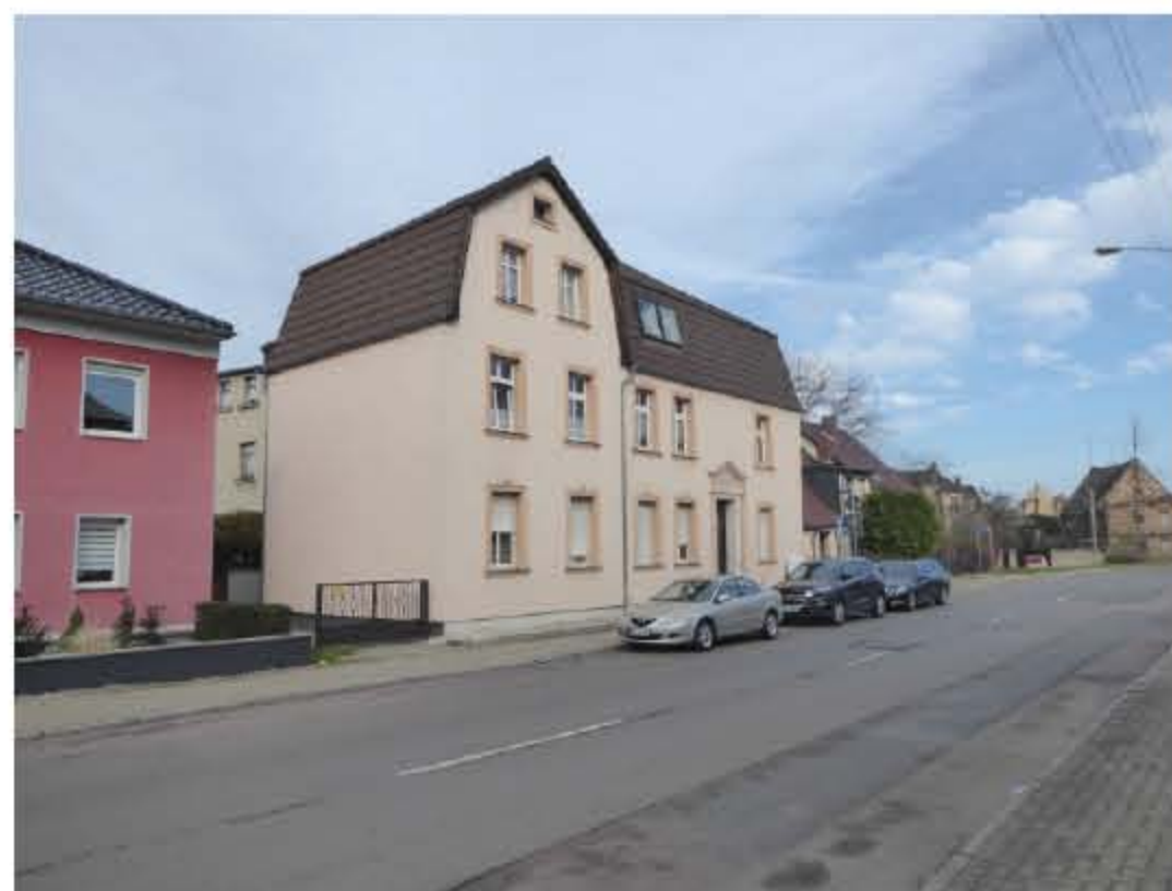
Das Wohnhaus 1912 in Nietleben (links, Foto: R. Brünnel), das Gebäude im heutigen Zustand sowie das Grabmal auf dem Granauer Friedhof (mit Blumen des Nietlebener Heimatvereins)

Lesetipp: Rolf Diemann: Schultze-Galléra - Heimatforscher für Halle und den Saalkreis - Werk und Leben, Hg. Bürgerverein Lieskau e. V., Langenbogen 2017.