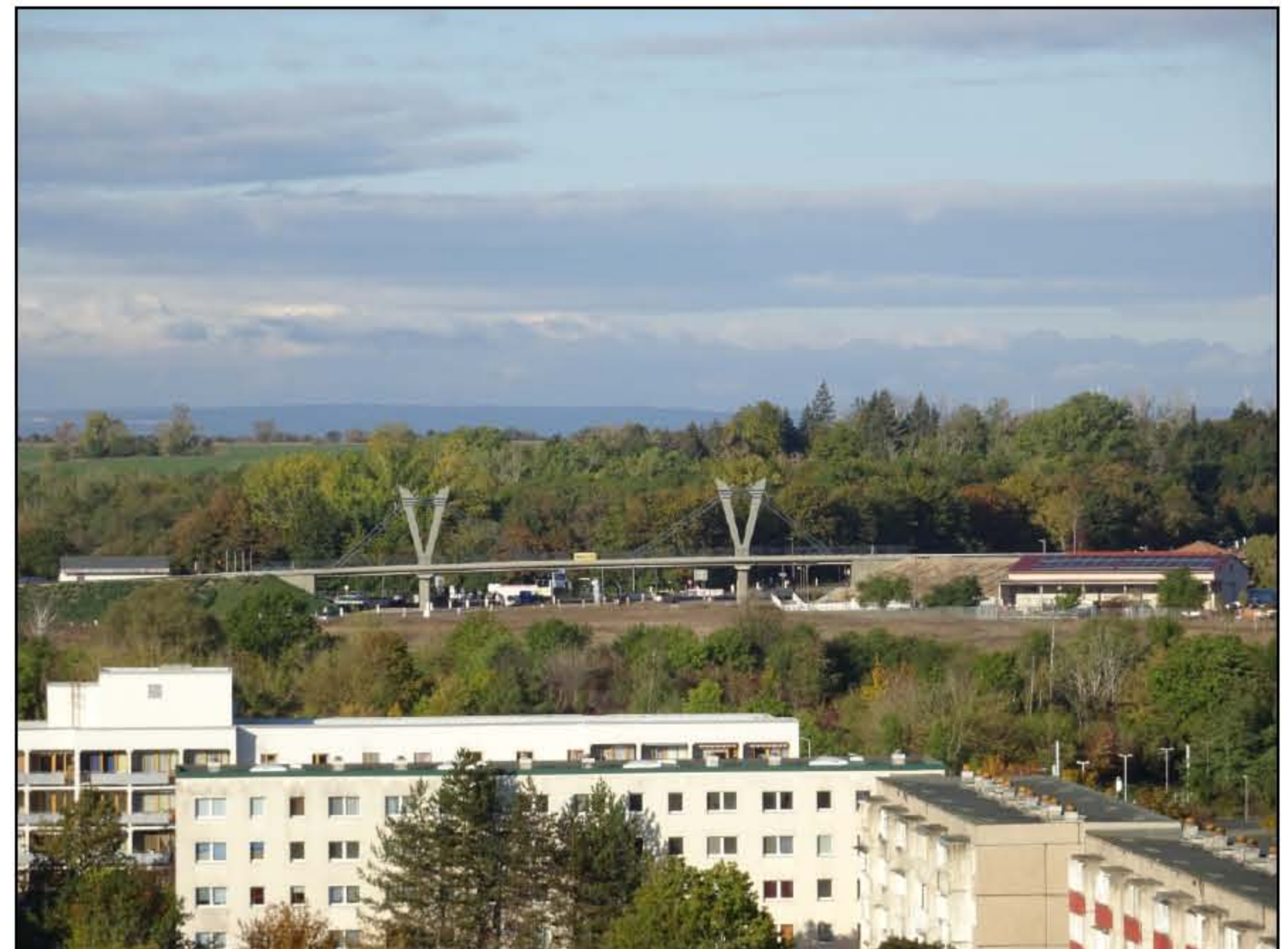
Die Brückenbaustelle Kreuzung B80 im November 2020 - von einem Neustädter Hochhaus aus gesehen